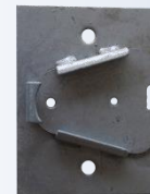
Montageplatte Art.-Nr.: 300 060 002

Innovationen - entwickelt und produziert in Deutschland