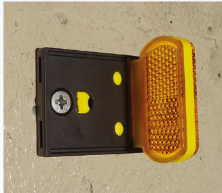
Montage an Betonschutzwand