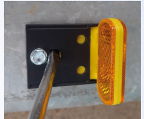
Demontage mit Schraubendreher