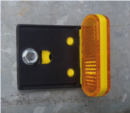
Montage an Metall-Schutzplanke

Mit uns haben Sie immer den richtigen Partner - für jede Entwicklung.